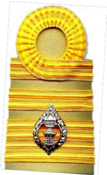
เครื่องแบบปฏิบัติราชการ (สีทากี)