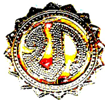
อจัตการบดีการ