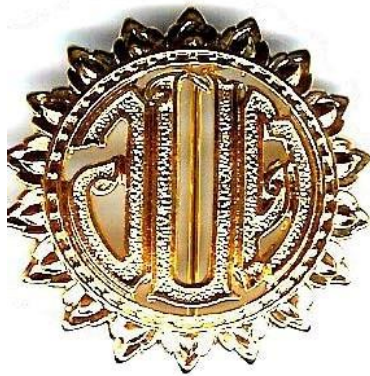
อจัตการบดีการส่วนตำบล