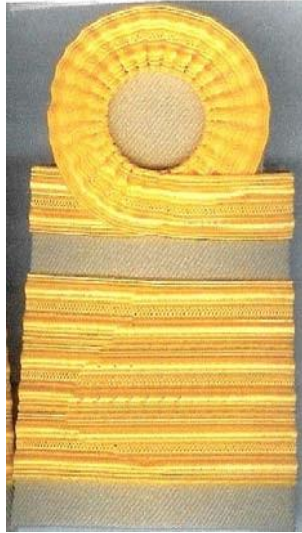
เครื่องแบบปฏิบัติราชการ (สีกากี)