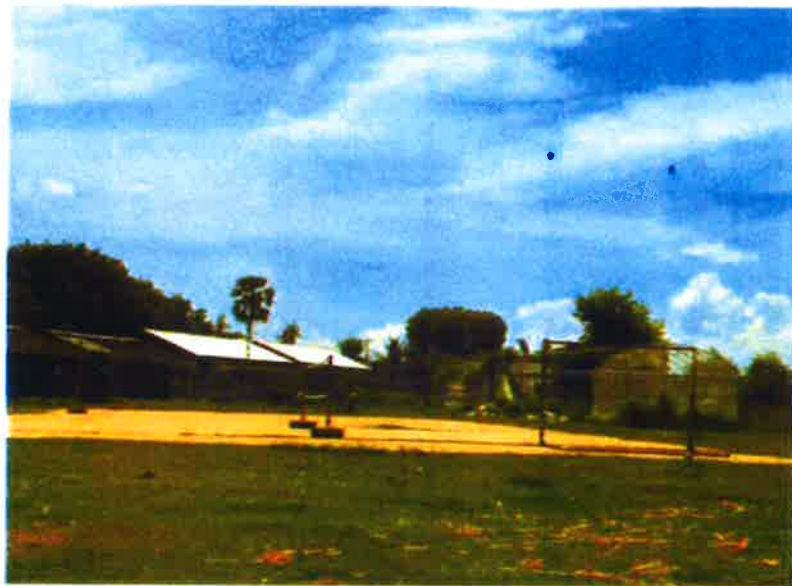
ศาลาประชาคมหมู่บ้าน ม.7 ต. ทองกลาง อ. จักราช จ.นครราชสีมา