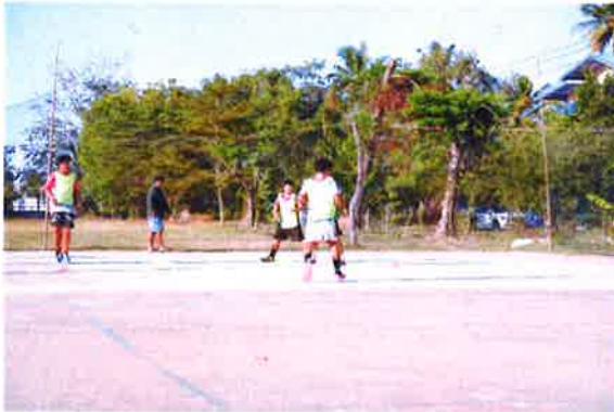
ภาพถ่ายลานกีฬาและสนามกีฬา บ้านตุม หมู่ที่ 9 ต.ทองหลาง อ.จักราช จ.นครราชสีมา