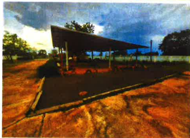
ลานกีฬาโรงเรียนบ้านทองหลาง ม.4 ต. ทองหลาง อ. จักราช จ.นครราชสีมา