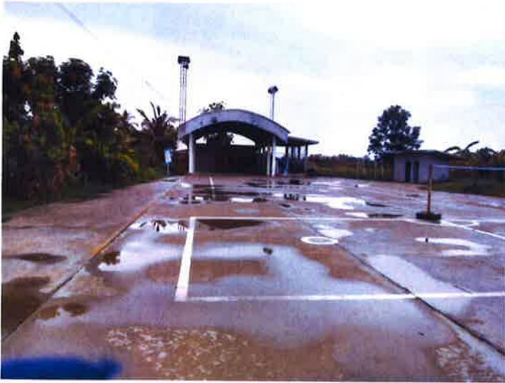
ภาพถ่ายลานกีฬาและสนามกีฬา บ้านทองหลาง หมู่ที่ 4 ต.ทองหลาง อ.จักราช จ.นครราชสีมา